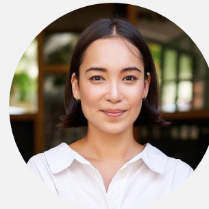
Grace Sales Representative